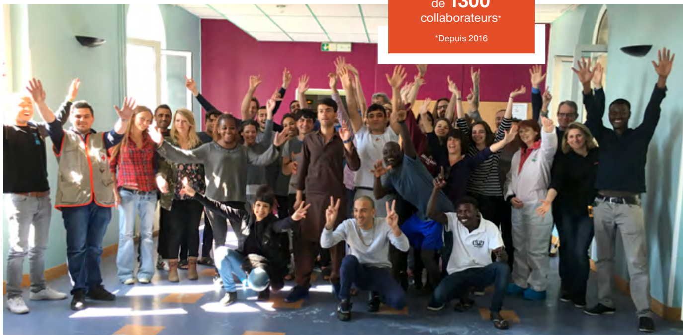
Chantier de rénovation d'une partie d'un centre d'hébergement d'urgence de la Croix-Rouge.

Inventaire de denrées alimentaires, préparation et distribution de repas à des sans-abris avec l'Association l'Un Est l'Autre.